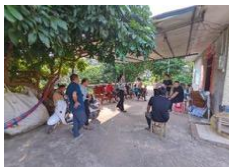
图 3 焦点小组座谈会