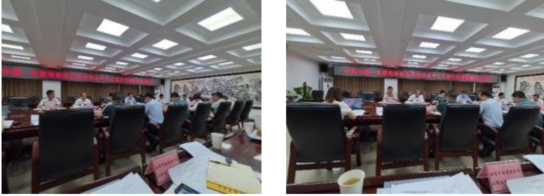
图 1 开展各级机构项目协调推进专题会议