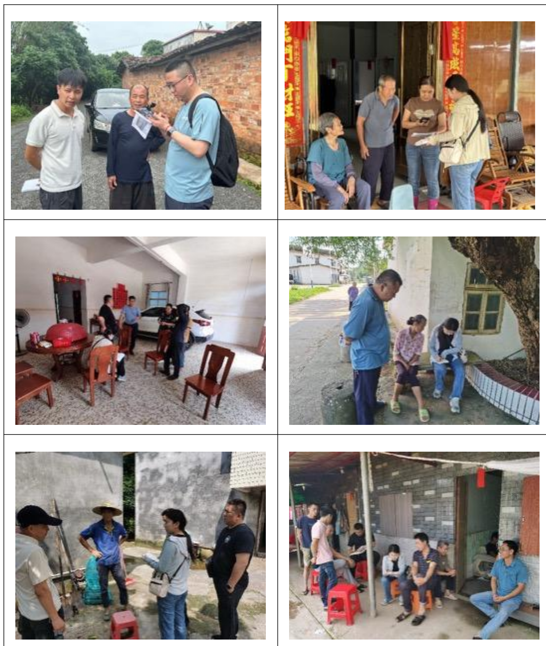
图 5 问卷调查现场

社区/村（皇马社区、城北社区、龙湾社区、横岭村、江表社区、大井社区、山塘社区、大垌村），发放调查问卷 400 份，共完成回收调查问卷 380 份，有效占比 95%。其中女性 176 人，占比 46%；少数民族（壮族）20 人，占比 5.3%；低收入 42 人，占比 11.05%。