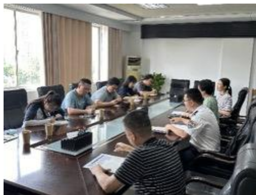
在钦北区人社局组织开展机构座谈会议，了解社保缴纳、劳动保障、就业技能培训等情况