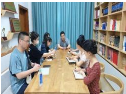
在妇联开展机构座谈会议，了解女性扶持政策及就业，以及对项目意见建议等情况

社区、山塘社区、大垌村)，共开展焦点小组座谈共计 16 场，参与人员约 240 人，女性约 84 人，占 35%；少数民族（壮族）14 人，占 6%。