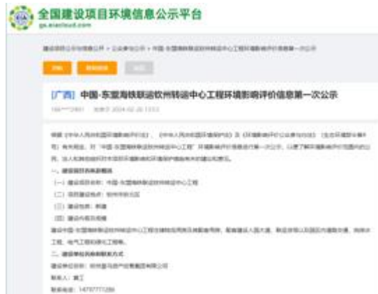
本项目 DEIA 第一次信息公开

同时，依据国内环境影响评价（DEIA）要求，在全国建设项目环境信息公示平台上完成了三轮公众公示，并借助《环球时报》等主流媒体发布公告，进一步扩大了信息覆盖范围。随后钦州市生态环境部门也依法对项目环境影响评价报告书的受理、审批及批复过程进行了三轮公示，保障了公众在项目前期阶段的知情权与参与权。