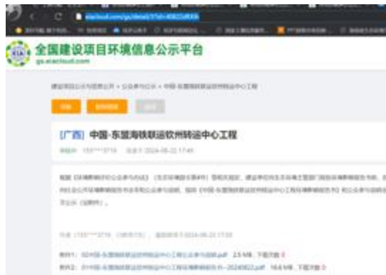
本项目 DEIA 第三次信息公开