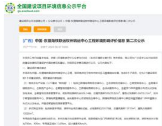
本项目 DEIA 第二次信息公开