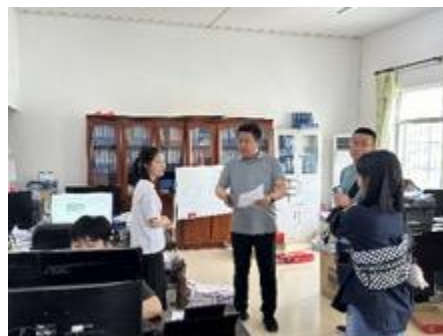
在钦北区民政局了解项目区社会保障情况