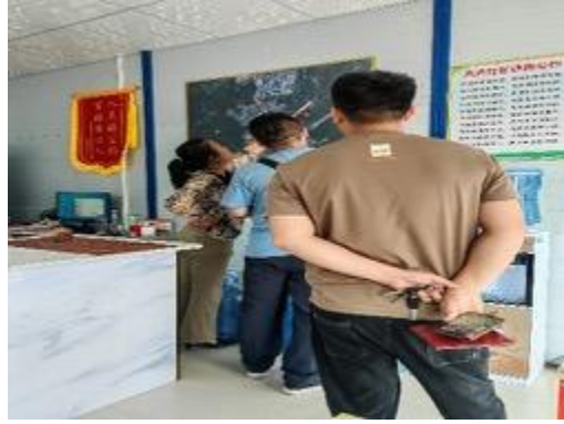
2.村/社区（居）委会了解基本情况