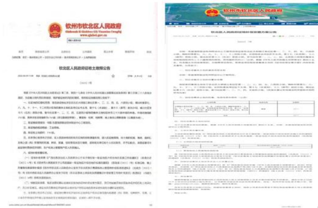
图 4-5 发布的征地预公告和征地补偿与安置方案

钦北区人民政府于2025年6月25日公布了征地补偿与安置方案的补偿资格及公告，公告中公布了征收集体土地的位置和范围、征收集体土地的权属、土地类型和面积、土地补偿标准和安置管理办法，以及再次明确了自本公告发布之日起，拟被征收集体土地村、组和土地承包经营者不得在拟征收集体土地上抢栽抢种作物或者抢建建筑物、构筑物。公布的征地补偿与安置方案的补偿资格及公告已在政府网站、项目区乡镇和受影响村的公告栏进行了张贴公示。