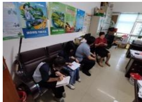
在钦北区民宗局了解项目区少数民族人口等情况