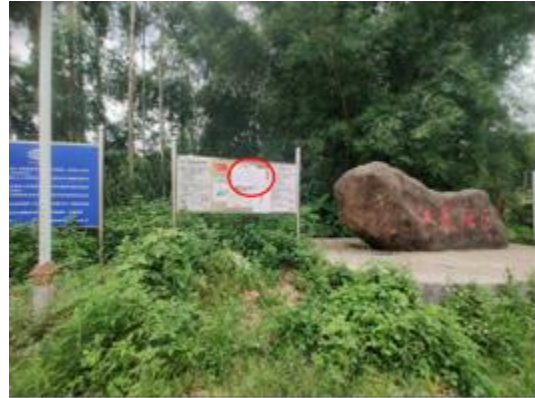
江表社区公示张贴