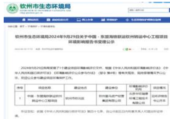
本项目 DEIA 第四次信息公开