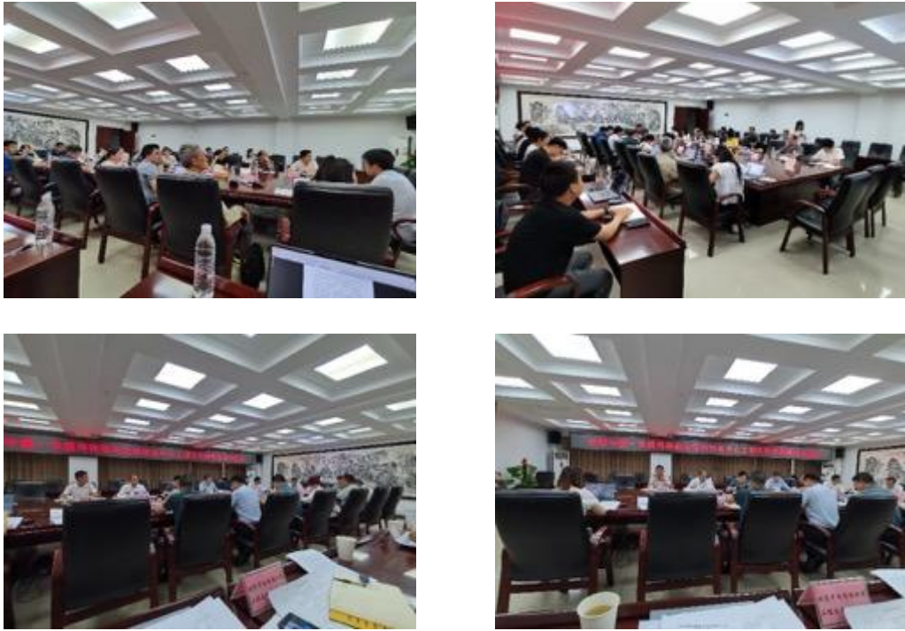
图 4-6 开展各级机构项目协调推进专题会议

通过座谈会、关键信息人访谈、实地踏勘及意见咨询等系列公众参与活动，系统收集并分析了各方意见，主要结果归纳如下：