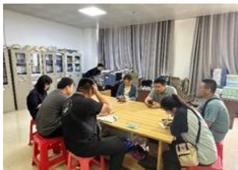
在皇马公司召开会议协调安排机构调查工作

环境社会顾问对项目影响区域乡镇街道、村/社区的关键信息者进行了访谈，以更充分地了解利益相关者对项目的态度，为项目设计和项目实施提供更好的建议。并走访了项目区钦北区自然资源局、征收中心、妇联、民政局、民宗局等机构负责人以及相关设施单位的负责人，搜集了相关的基础数据和相关材料；并在项目所涉及到的社区居委会/村委会与村民代表等人员进行了访谈。共计访谈关键信息者 45 人，其中女性 15 人，占比 33%。