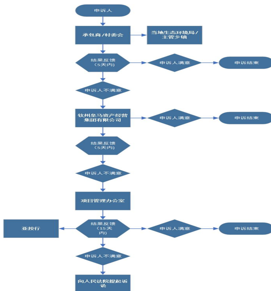
图 8-1 申诉机制运作图

第四阶段:如果申诉人对上述的决定仍不满意,可以在收到决定后,可以根据《中华人民共和国民事诉讼法》,向民事法庭起诉。