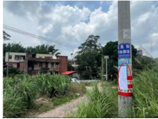
水浸洞村公示张贴