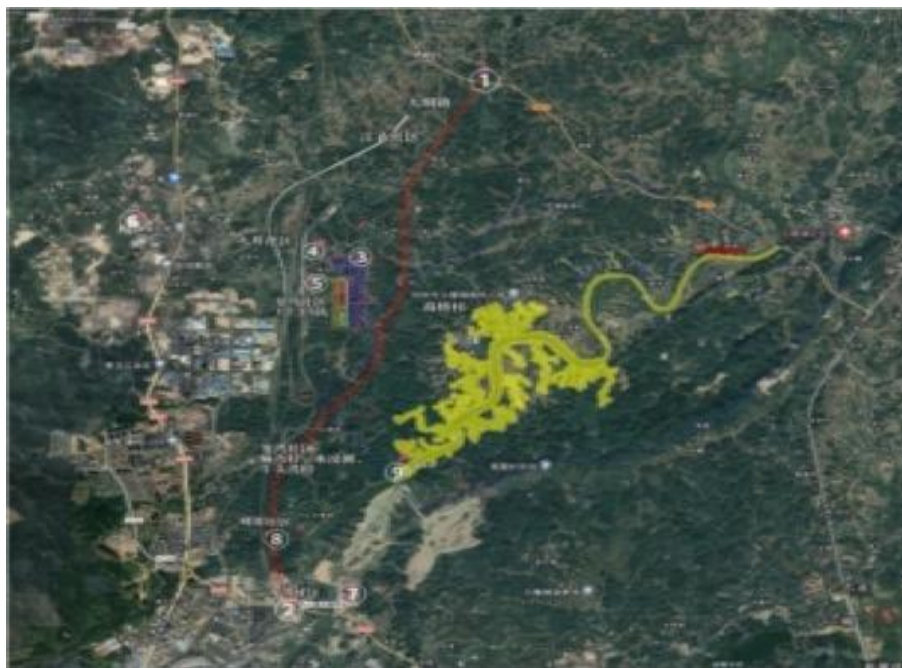
图 1-2 项目受影响街道和村镇