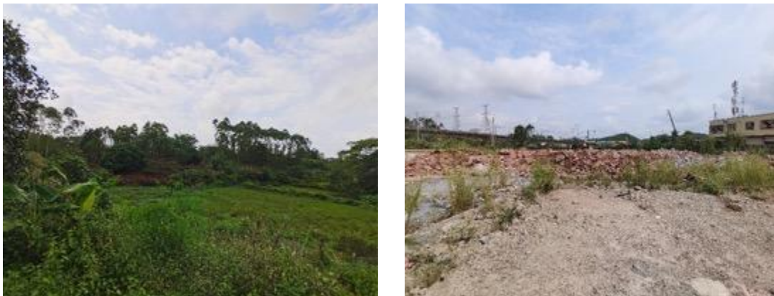
图 2 环境社会顾问实地查勘图

环境社会顾问对项目工程选址和所在地周边的乡镇、社区/乡村进行实地考察，更为实际、客观地了解了子项目选址和对周边居民生产生活的影响、征地拆迁、环境影响、生物多样性影响情况等。