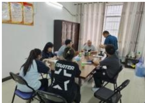
在钦北区征收中心了解项目政策及补偿安置等情况