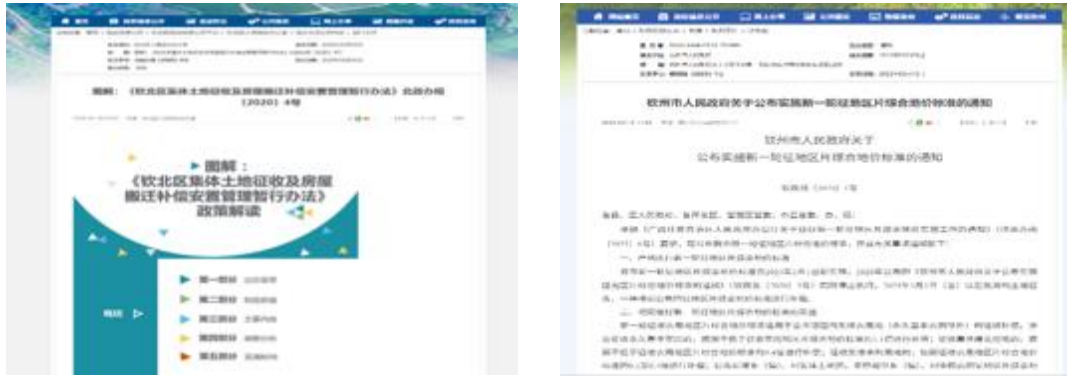
图 4-6 项目土地征收及拆迁安置政策公开情况