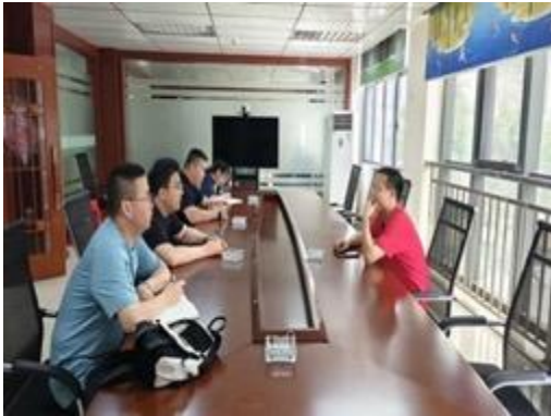
海诺尔城市生活垃圾焚烧厂