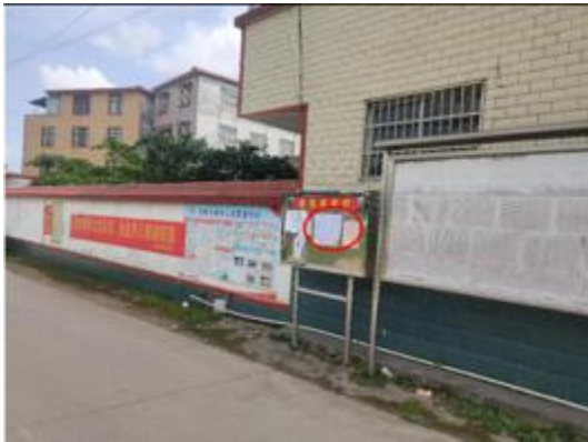
皇马社区公示张贴

为充分保障项目影响范围内公众的知情权与参与权,2024 年 8 月 7 日至 8 月 21 日期间，环境社会顾问团队在皇马社区、江表社区、老把村、清塘村、麻芎村、水浸洞村等沿线社区和村庄的公告栏，公开张贴了项目环境与社会影响公告。公告内容包括项目潜在的环境与社会影响、拟定的缓解与管理措施，以及公众意见征求方式和申诉渠道。在信息披露的基础上，进一步组织磋商活动，广泛征求居民意见，确保不同年龄、性别、民族、教育背景和经济状况的群体均能便捷获取项目信息并有效参与。